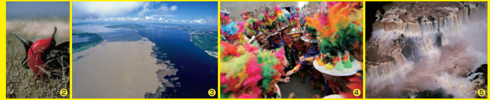
①(ボイブンバと呼ばれる奇祭)ブラジル 田中克佳 ②(ガラバゴスオオグンカンドリ)エクアドル 中村征夫 ③(アマゾン川本流とリオ・ネグロの合流点)ブラジル 野町和嘉 ④(アンデスの民族舞踏ティンクの踊り手)ボリビア 白根 全 ⑤(イグアスの滝)ブラジル/アルゼンチン/パラグアイ 清水武男