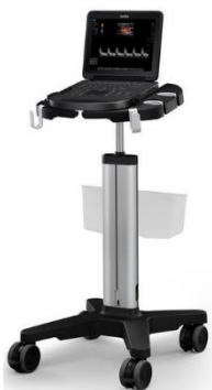
Edge II スタンド