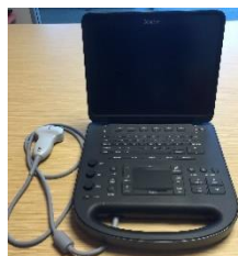
コンバックスプロローブ rC60xi 接続時