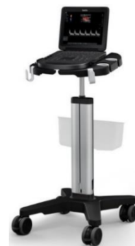
装置本体を Edge II スタンド (オプション) に装着時