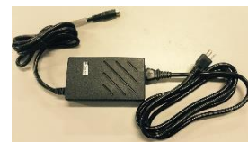
AC 電源アダプタ及び電源ケーブル