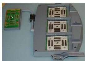
トリプルプローブコネクタ